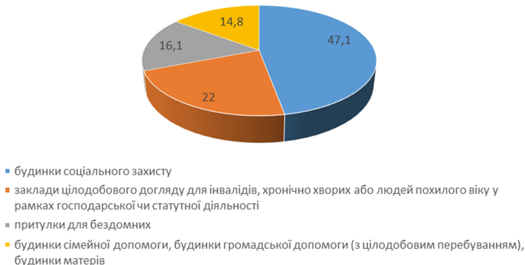
Рис. 1. Стационарні заклади соціального захисту населення Польщі (складено автором за [7])

одягу, продуктів харчування та фінансової підтримки; утримання притулків для бездомних або допомога їм іншим способом; допомога жертвам стихійних лих; допомога біженцям. При цьому особа може одержувати одночасно кілька видів повноцінної допомоги без обмежень [2].