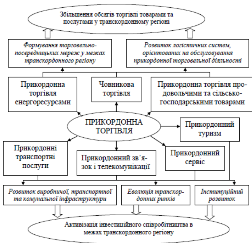
Рис. 3. Прикордонна торгівля в механізмі становлення та розвитку зовнішньоекономічних зв'язків транскордонного регіону (авторська розробка)

Важливою перевагою транскордонної торгівлі як засобу стимулювання зовнішньоекономічної діяльності у межах транскордонного регіону є її «дешевизна», а саме – відносно низькі витрати на розгортання цього виду підприємницької діяльності та формування елементів інфраструктури бізнесу. З цього приводу дослідники зазначають: «Головним спонукаючим мотивом до участі у прикордонній торгівлі виступає невисокий рівень матеріальної забезпеченості громадян... Переважна більшість міграційних переміщень мотивується отриманням доходу шляхом ввозу недорогих товарів споживання з сусідніх країн. Оскільки на товари, які ввозились в державу фізичними особами, довгий час не накладались мита, водночас аналогічні товари, які ввозили в Україну фірми-імпортери, обкладались досить високими ставками мита. Таким чином, більшість осіб, задіяних в прикордонній торгівлі з 1990-х років, можна віднести до категорії «підприємці мимоволі» [16].