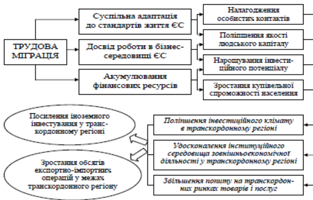
Рис. 4. Трудова міграція в механізмі становлення та розвитку зовнішньоекономічних зв'язків транскордонного регіону (авторська розробка)

Експерти відзначають, що зовнішня трудова міграція є також джерелом досвіду, знань, міжособистісних контактів, школою бізнесу та ринкової поведінки. Крім цього, значні кошти, які надходять від заробітчан, підвищують платоспроможний попит і таким чином стимулюють виробництво. Вони сприяють розвитку малого бізнесу, прискоренню формування середнього класу [18]. Все це позитивно відображається на активізації зовнішньоекономічних зв'язків у межах транскордонних регіонів, стимулюючи процеси європейської інтеграції нашої держави.