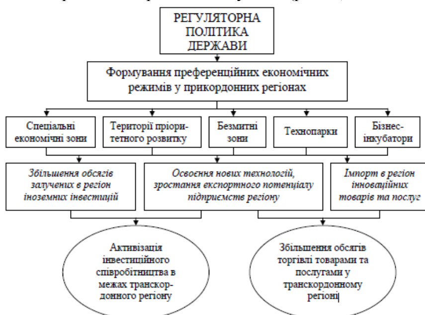
Рис. 2. Алгоритм дії преференційного механізму становлення та розвитку зовнішньоекономічних зв'язків у транскордонному регіоні (авторська розробка)

Механізм дії преференційних режимів у транскордонних регіонах полягає у стимулюванні іноземного інвестування, освоєння нових технологій та імпорту високотехнологічного обладнання, що веде до розвитку транскордонного бізнесу та диверсифікації транскордонних ринків товарів і послуг. Як наслідок, відбувається активізація інвестиційного співробітництва у межах транскордонного регіону, а також збільшуються обсяги транскордонної торгівлі товарами і послугами (рис. 2).