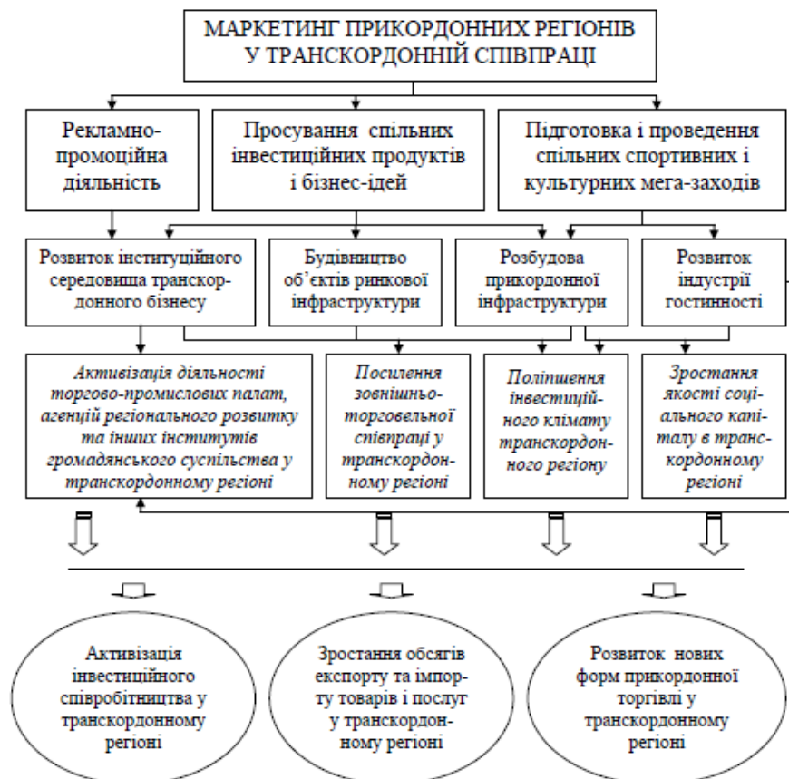
Рис. 5. Маркетинговий інструментарій механізму становлення та розвитку зовнішньоекономічних зв'язків у транскордонному регіоні (авторська розробка)

Як правило, найкращих результатів у соціально- економічному розвитку досягають ті прикордонні території, маркетингові зусилля яких спрямовані на комплексне вирішення нагальних проблем – ефективну реалізацію основних функцій території як місця проживання, відпочинку і господарювання; покращення методів управління та інфраструктури; підвищення конкурентоспроможності розміщених на території підприємств. Усе це досягається в контексті активізації зовнішньоекономічних зв'язків у межах відповідних транскордонних регіонів. Відтак на сучасному етапі економічних реформ в Україні транскордонний маркетинг як складова інструментарію здійснення державної регіональної політики покликаний забезпечувати розвиток та стійке економічне зростання регіонів, їх інтеграцію в загальнодержавний та міжнародний економічний простір, стимулювати зовнішньоекономічну та інноваційну діяльність у транскордонних регіонах [22].