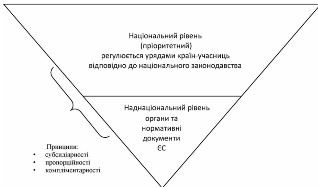
Рис.2. Рівні регулювання ринку медичних послуг в ЄС.

Воєнна агресія Російської Федерації на території України дала поштовх для розвитку євроінтеграційних процесів. Зокрема перспективи членства в ЄС та статус кандидата проклали шлях до історичної події – 14.07.2022 року Європейська Комісія ухвалила рішення про затвердження Угоди між Україною та Європейським Союзом про участь України у програмі «EU4Health» [7], яка є ключовим інструментом реалізації політики охорони здоров'я в ЄС. Положення Угоди про асоціацію та асоційоване членство у програмі «EU4Health» фактично означають для нашої держави старт процесу розбудови поліструктурної моделі регулювання ринку медичних послуг, притаманної для ЄС. Схематично представимо зазначену модель на рис.2.